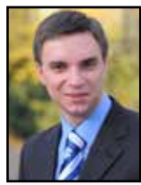
REDAGUJE ANDRZEJ RYBUS-TOŁŁOCZKO SPECJALISTA DS. MONITORINGU