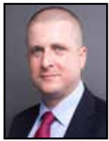
REDAGUJE PAWEŁ TROJANOWSKI